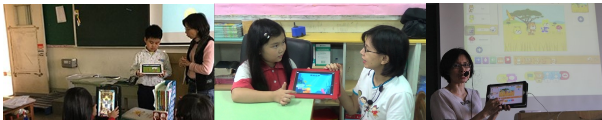
新北市林口國小上課實況

為了迎接世界性的兒童學習程式風潮，台灣資訊教育發展協會設計一系列程式設計課程到國小社團推廣，其中麻省理工學院設計的 Scratch(塗鴉)和 ScratchJr(小塗鴉)二種程式語言是最普及的，這兩種語言共同的主角是一隻小貓，學生可以在電腦上拖拉程式積木來指揮小貓活動，做出千變萬化的程式和遊戲。所以我們的社團就叫作「喵星人遊戲國」。學生要在王國中學習如