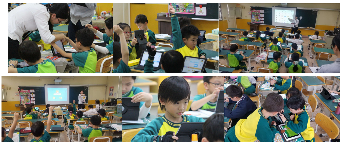
台北市私立光仁小學上課實況